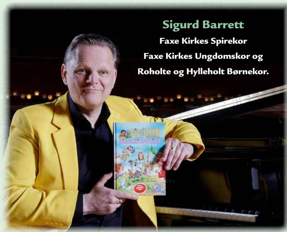
Sigurd Barrett Faxe Kirkes Spirekor Faxe Kirkes Ungdomskor og Roholte og Hylleholt Børnekor.

Sigurd Barrett giver koncert i Faxe Kirke sammen med områdets tre børne- og ungdomskor; Faxe Kirkes Spirekor, Faxe Kirkes Ungdomskor og Roholte og Hylleholt Børnekor.